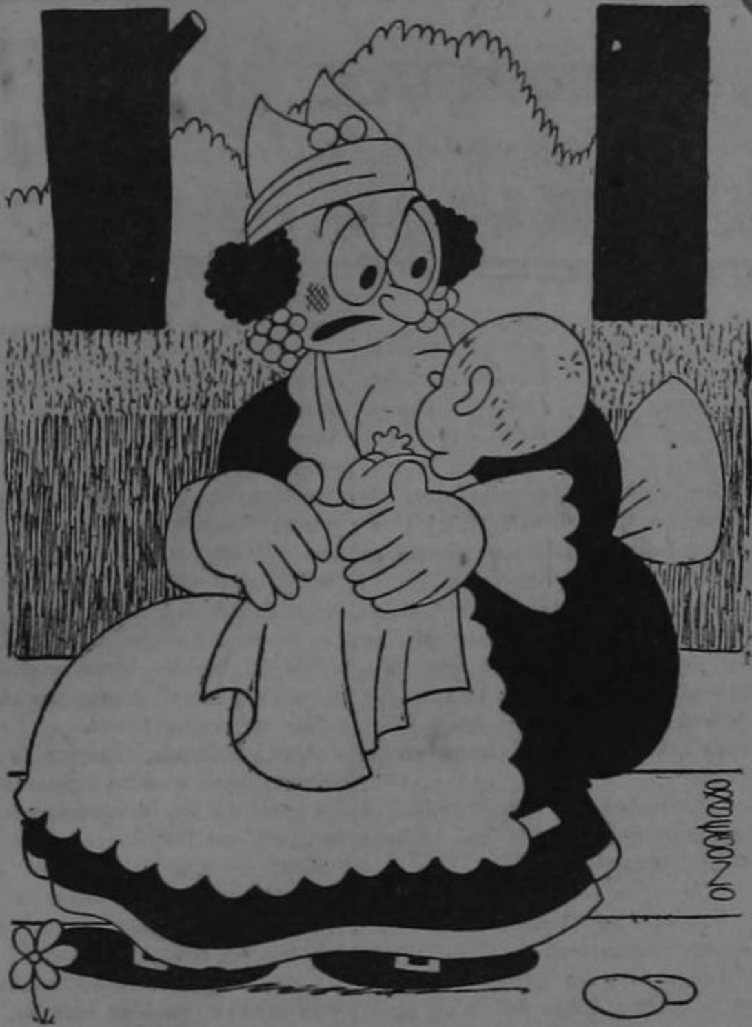
En un banco del Parque Central —Míren como se han vuelto los niños del banco, del Central.